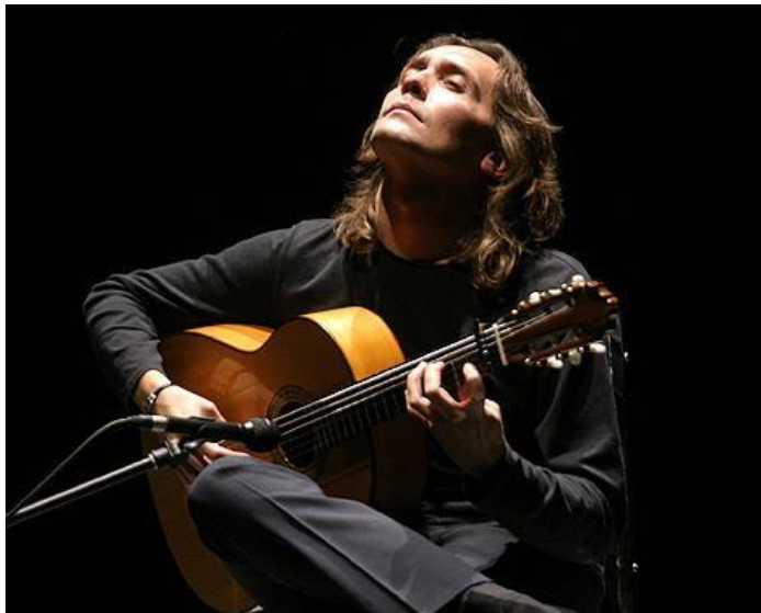
Vicente Amigo Girol

(25 de marzo de 1967, Guadalcanal, España)