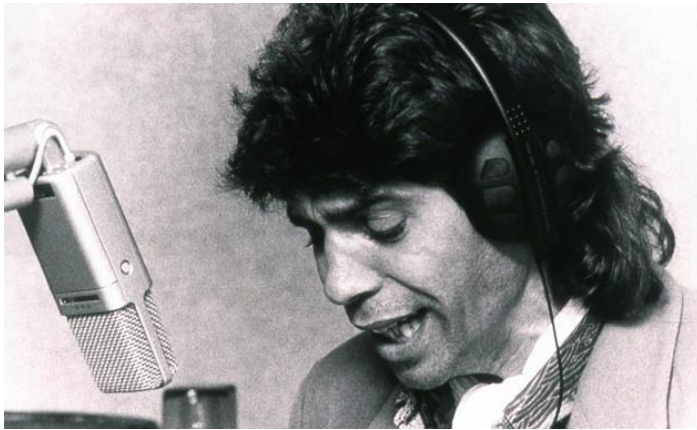
José Monge Cruz “Camarón de la Isla”

(5 de diciembre de 1950, San Fernando, España – 2 de julio de 1992, Badalona, España)