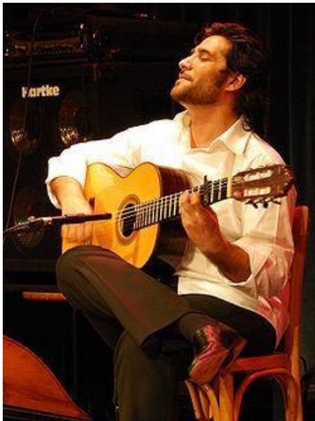
Juan José Heredia "Niño Josele"